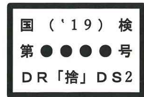
型式検定合格標章の例 (使い捨て式、DS2)

防じんマスクの選定基準については、H17.2.7付け基発第0207006号に示されています。